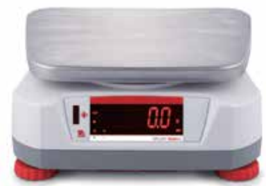
Rückwärtiges Display mit integriertem berührungslosen Sensor